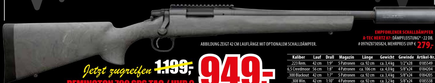
ABBILDUNG ZEIGT 42 CM LAUFLÄNGE MIT OPTIONALEM SCHALLDÄMPFER.

NEU! JETZT MIT ERWEITERTER KALIBERPALETTE