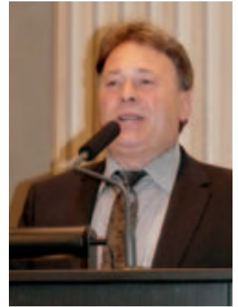
Staatsminister Helmut Brunner beim Symposium zur Fortentwicklung des Vegetationsgutachtens in München

Die Mehrheit der Redner hat sich für regelmäßige Revierbegänge ausgesprochen. Dies begrüße ich sehr. Auf den Revierbegängen sollten auch andere jagdliche Themen behandelt werden, wie Schwarzwildschäden in der Landwirtschaft oder Lebensraumverbesserungen. In diesem Zusammenhang werde ich für die nächste Programmplanung die Schaffung eines „Wald-KULAP“ prüfen. Dabei ist vor allem an die Anlage von extensiv bewirtschafteten Flächen und Randstreifen an den Waldrändern gedacht, um Äsungsmöglichkeiten außerhalb des Waldes zu schaffen.