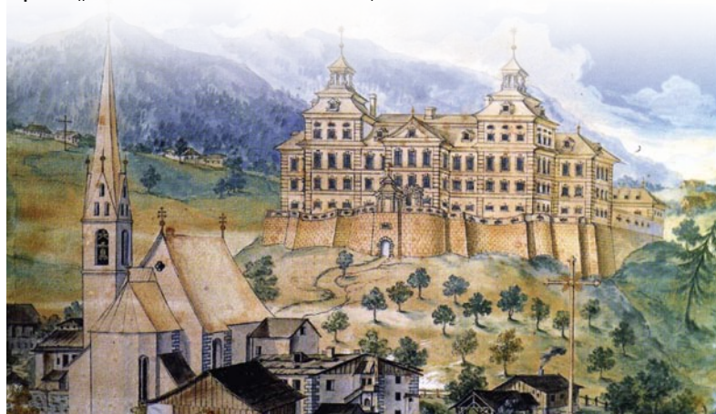
Aquarell „Wolfsthurn von der vordern Seiten“, J. G. Pruner (1740)