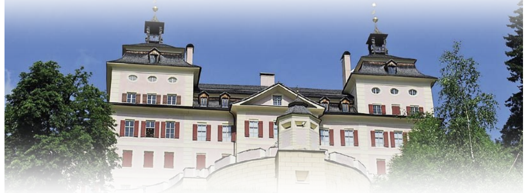
Hoch über der kleinen Ortschaft Mareit am Eingang des Tals Ridnaun thront das barocke Schloss Wolfsturn.