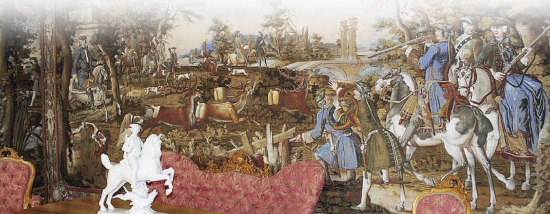
Jagdzimmer mit Gobelins herrschaftlicher Jagdszenen, auf Rupfen gemalt von einem unbekanntem Künstler

Die Jagdgeschichte von Tirol war durch Jahrhunderte von jagdbegeisterten Landesherren bestimmt. Unter Kaiser Maximilian I. (1459 – 1519) und Erzherzog Ferdinand II. (1566 – 1595) fanden traditionelle Hofjagden, regelmäßige Schaujagden, aber auch prunkvolle Staatsjagden für ausländische Herrscher und Diplomaten statt. In der zweiten Hälfte des 17. Jahrhunderts verlor mit dem Aussterben der Tiroler Habsburger Linie – Erzherzog Sigmund Franz verstarb 1665 an den Folgen einer Krankheit, die er sich nach einer Schweinschatz in den Sümpfen von Kaltern geholt hatte – das Jagdwesen an Bedeutung. Die Zeit der großen aristokratischen Gesellschaftsjagden ging zu Ende. Kaiserin Maria Theresia schrieb 1743 die Hohe Jagd und alle landesfürstlichen Jagden zur Pacht aus, was eine starke Reduktion, sogar teilweise Ausrottung des Wildbestandes zur Folge hatte. Um die Wende des