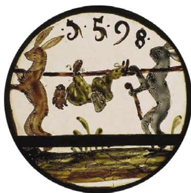
Kabinettscheibe (1598): Darstellung der „verkehrten Welt“

Jagd und Fischerei werden im Museum Wolfsthurn nicht aus rein naturhistorischer Sicht betrachtet, sondern als Teil der Kulturgeschichte,