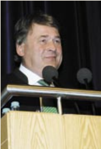
Versprach Verbesserungen: Staatsminister Helmut Brunner kam kurzfristig doch zum Landesjägartag.