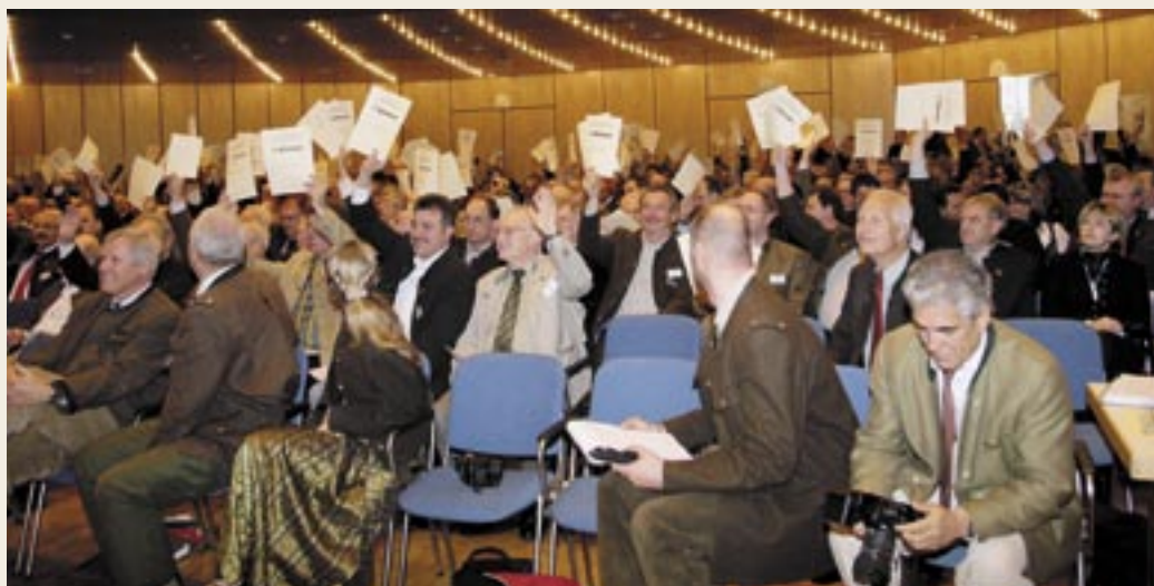
Da blieb kein Stimmzettel unten: Die Wahl des BJV-Präsidenten erfolgte ohne jede Gegenstimme und ohne Enthaltungen. Es waren 617 der 684 existierenden Delegiertenstimmen anwesend.

Über die Tagung der 16 BJV-Fachausschüsse, Arbeitskreise und Expertenrunden am Vormittag vor der Landesversammlung berichten wir in den nächsten Ausgaben. Während die Teilnehmer