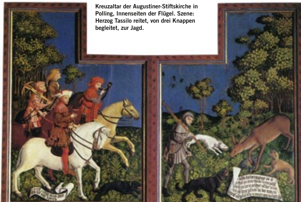
Kreuzaltar der Augustiner-Stiftskirche in Polling, Innenseiten der Flügel. Szene: Herzog Tassilo reitet, von drei Knappen begleitet, zur Jagd.

aus den Wäldern Wessobrunns rankt sich um die Gründung des Klosters Thierhaupten nördlich von Augsburg. Der erst neunjährige Tassilo soll auf einer Pirsch von seinen Jagdbegleitern getrennt worden sein und verirrt sich im Wald. Als die Nacht hereinbrach, sank er erschöpft nieder. Er hatte sich verletzt und fürchtete um sein Leben. Er flehte um himmlische Hilfe und gelobte, bei seiner Errettung ein Kloster errichten zu wollen. Der Sage nach wies ihm daraufhin eine Hirschkuh den Weg. Herzog Tassilo III. gründete zum Dank die spätere Benediktinerabtei Thierhaupten (750). Der Name der Stadt Thierhaupten hat seinen etymologischen Ursprung im rettenden „Rotthier“ Tassilos. Deshalb ist auch im Wappen der Stadt ein Kahlwildhaupt abgebildet.