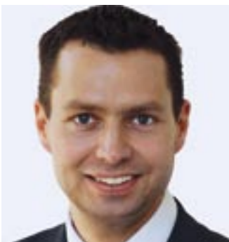
Stephan Mayer, MdB, Innen- und rechtspolitischer Sprecher der CSU-Landesgruppe steht auf der Seite der bayerischen Jäger.

Der BJV bekommt weitere Rückendeckung in Sachen Wildursprungszeichen, gegen dessen Einführung er sich einsetzt: Stephan Mayer, MdB, Innen- und rechtspolitischer Sprecher der CSU-Landesgruppe, hat den bayerischen Jägerinnen und Jägern seine Unterstützung zugesagt.