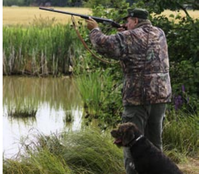
Unverzichtbar: Ein ruhiger Hund beim Schuss auf der Entenjagd

Um den Hund gut auf die Jagdsaison vorzubereiten, kann man auch eine kleine Wasserjagd mit anderen Hundeführern simulieren. Knaunzen, Winseln oder Belen lassen sich dabei gut abtrainieren. Ein Helfer verschießt dabei mehrere Dummies. Nach etwa fünfminütiger Ruhe werden die Hunde einzeln zum Bringen geschickt. Es ist peinlichst darauf zu achten, dass sich nur ein Hund im Wasser befindet. Der nächste sollte erst geschnallt werden, wenn der Führer des vorher arbeitenden Hundes klar zu erkennen gibt, dass sein Vierbeiner angeleint ist. Hunde, die bei dieser Übung Gebärden der „Schusshitze“ oder Laut geben, werden nicht geschnallt, sondern vom Führer beruhigt. Sie müssen den anderen tatenlos zusehen. Die Übung „Stöbern mit Ente im deckungsreichen Gewässer“ ist grundnotwendig für eine waidgerechte und tierschutzkonforme Jagd auf Wasserwild. Hier zeigt der Vierläufer, ob er in der Lage ist, krankes Wild zu finden und zu apportieren. Weil dafür aber unter anderem tierschutzrechtliche Bestimmungen zu beachten sind, sollte sich der Hundeführer an seinen Prü-