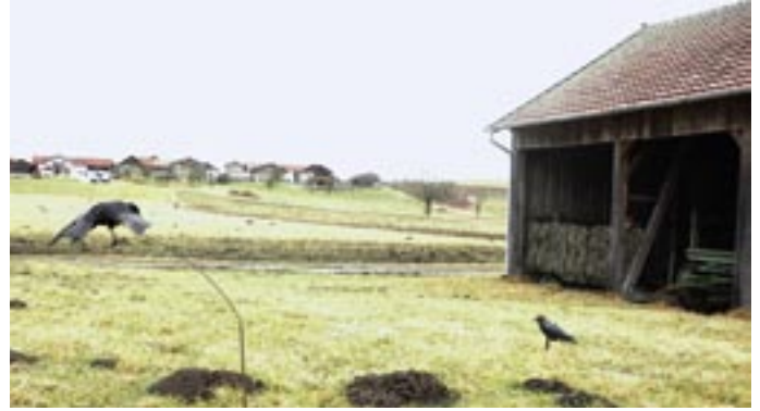
Mit beweglichen Gleitern können erlegte Krähen im Lockbild platziert werden.

eine Futtersituation nach. Dabei achte ich darauf, dass das Bild aus allen Richtungen gut zu sehen ist. Um den Reiz für heranstreichende Krähen zu erhöhen, lege ich in die Mitte meiner „Krähenschar“ ein Stück Fallwild, zum Beispiel einen Hasen, oder auch bloß eine Plastiktüte, und stelle eine Krähe direkt daneben. Auch eine „Wächterkrähe“ darf nicht fehlen: Diese Attrappe setze ich auf einen Stab oder einen Zaunpfosten oder platziere sie mithilfe einer Teleskop-Stange im Gebüsch oder auf dem Dach eines nahen Schuppens.