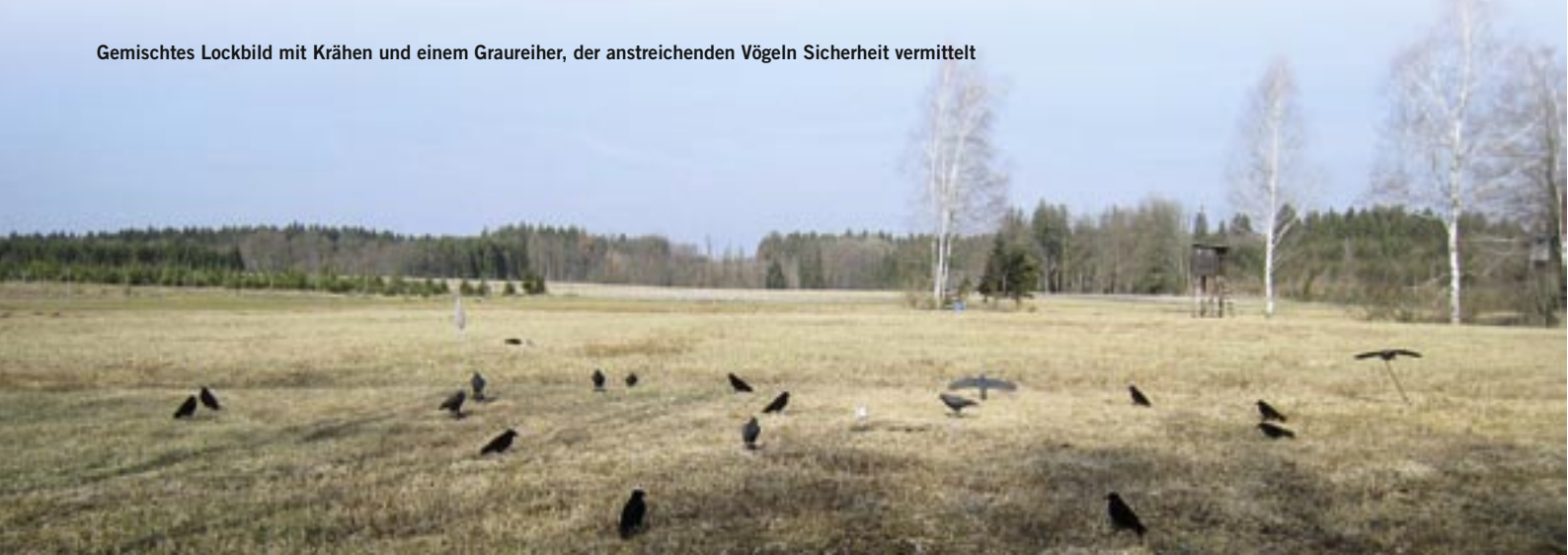
Gemischtes Lockbild mit Krähen und einem Graureiher, der anstreichenden Vögeln Sicherheit vermittelt

Mit 15 bis 20 Lockkrähen aus Plastik bilde ich im freien Feld