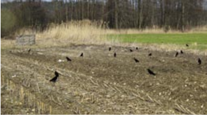
Lockkrähen vor dem Schirm des Jägers imitieren eine Futtersituation.