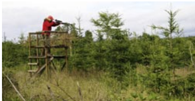
Bei der Drückjagd sollte nicht auf gewöhnliche Hochsitze zurückgegriffen werden, sondern auf niedrige Stände, die große Bewegungsfreiheit bieten.

Führen die Treiben beispielsweise entlang von oder über Straßen, sollte man rechtzeitig Kontakt mit der örtlichen Straßenverkehrsbehörde aufnehmen und Schilder oder gar Posten zur Absicherung organisieren.