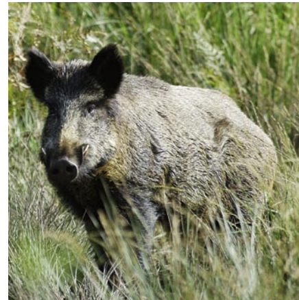
Auch Überläufer sollten im Frühjahr streng bejagt werden, allerdings vor allem die jungen Bachen.

Mit welcher Jagdart man letztlich an den gewünschten Prozentsatz herankommt, hängt von den strukturellen Gegebenheiten eines Gebietes und den jeweiligen Ernährungsbedingungen ab. Bei größeren Waldgebieten führt die Einzeljagd mit Kirtung kaum zum Erfolg. Hier sind gut organisierte Drückjagden eher zielführend. Allerdings reicht es meist nicht, alles Schwarzwild außer der Leitbache freizugeben, um einen ausreichenden Frischlingsanteil zu erzielen. Wichtig sind vielmehr disziplinierte, erfahrene Schützen und der Hinweis: „Von unten nach oben vorrangig. Frischlinge und geringe Überläufer erlegen – grobe Sauen schonen“. In Regionen, wo den Jägern allerdings noch die Erfahrung fehlt, die einzelnen