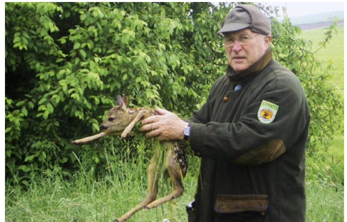
Suchen Sie vor dem Mähtermin, am besten mit Hunden, die Wiesen ab und tragen Sie die gefundenen Kitze behutsam aus der Wiese!

● Gerhard Pumm, Gerhard Kneiße und Wolfgang Achtzehner haben den Wildretter LARS entwickelt – eine Art „Wildscheuche“, die die Geißen durch akustische und optische Signale dazu bringen soll, ihr Kitz aus der Wiese