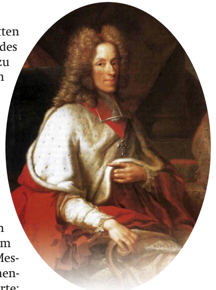
Joseph Clemens Kajetan von Bayern (1671 – 1723) war Kurfürst des Heiligen Römischen Reiches und Fürstpropst von Berchtesgaden. Die Jagdleidenschaft des Wittelsbachers und seine legendären Hofjagden Anfang des 18. Jahrhunderts sind in verschiedenen Chroniken der Fürstpropstei belegt. (Porträt aus dem Musée des Beaux Arts, Valenciennes)

haltung mit Jagd von staten ging, ist einer Chronik des Franziskanerklosters zu entnehmen, die von dem Besuch Joseph Clemens vom 23. bis 27. Oktober des Jahres 1715 berichtet: „Am anderen Tage ließ sich der Kurfürst unter feierlichen Zeremonien zur Franziskanerkirche bringen, wo er die Errichtung des Convents mit folgenden Worten statuierte, indem er sich zum Schluß der Messe zu dem hinter ihm stehenden Provincial umkehrte: 'Hiermit erteilen wir Ihnen pro introductione et erectione monasterii unseren gnädigsten Consensus. Gleich werde ich mich auf das Gamsjagen verfügen – gehen Sie zu den Herren Capitularen und sehen Sie, dass Sie auch den Consensus erjagen!' Nach dieser in lapidarer Kürze gehaltenen Rede verfügte der Kurfürst und Propst sich in das Wimbachtal zur Jagd. Erst spät in der Nacht kehrte er von dort zurück und brachte einige Stück lebendig gefangene Gamsen heim“, so die Chronik. 1803 endete die Fürstpropstliche Herrschaft durch den Reichsdeputationshauptschluss, das letzte bedeutende Gesetz des Heiligen