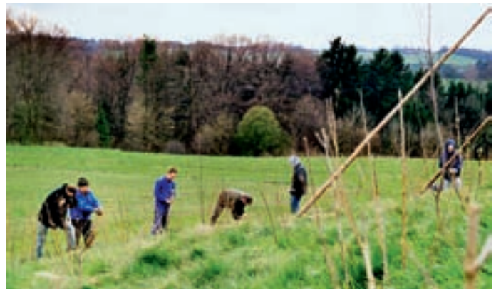
Wer jetzt Büsche oder Bäume pflanzt, sollte damit auch baldmöglichst fertig werden – dann wachsen die Pflanzen besser an.

Der Standort von Hecken und Feldgehölzen ist immer abhängig von den örtlichen Gegebenheiten und der geplanten künftigen Funktion. In der Regel werden Hecken entlang von Flurstücksgrenzen gepflanzt. Dabei ist auf den im Bürgerlichen Gesetzbuch geregelten Grenzabstand zu achten. Er beträgt bei Hecken über zwei Metern Höhe zwei bis vier Meter. Es muss auch bedacht werden, dass Hecken