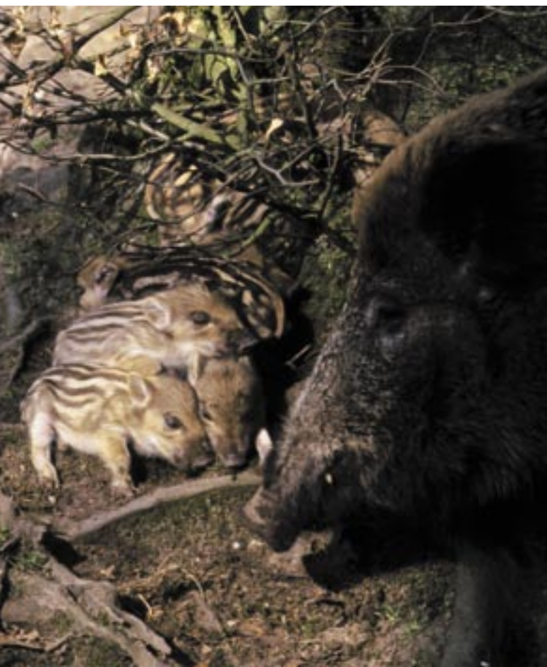
Bachen mit Hormonen zu behandeln, wäre eine Bankrotterklärung der Jagd.