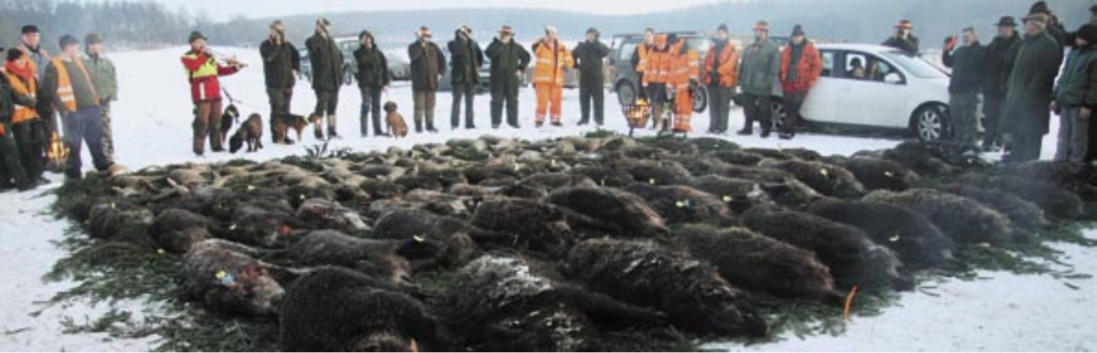
Gut organisierte, diszipliniert durchgeführte Drückjagden in Herbst und Winter helfen, das Schwarzwild auf einen angemessenen Bestand zu reduzieren.

spruch, tierschutzgerecht und biologisch sinnvoll zu jagen, aufrechterhalten wollen.