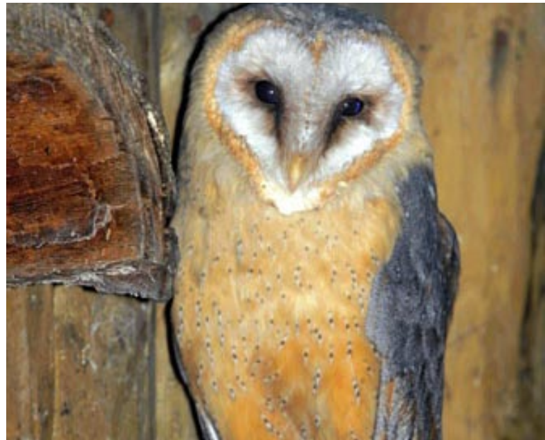
Schleiereulen kann im Winter geholfen werden, indem Landwirte ihnen Einflughöcher in Scheunen offen lassen. Der Dank: Die Vögel fressen die Mäuse.

So finden sich am Nistplatz des Uhus oftmals Reste von Waldohreule oder Waldkauz. Der Waldkauz wiederum sieht Kleineulen wie Raufuß- oder Sperlingskauz als Beute an. Gerade in schneereichen und kalten Wintern wird die Bedeutung einer strukturreichen Kulturlandschaft ersichtlich: Entlang von Grenzlinien wie Hecken, Rainen oder Waldrändern nutzen Kleinsäuger ausgeaperte Stellen und sind somit als Beutetiere für die Eulen leichter verfügbar. Fehlen derartige Strukturen, weichen Eulen beim Beutefang oft auf geräumte Straßen aus. Leider fallen sie dabei leicht selbst dem Verkehr zum Opfer. Von Waldohreulen ist bekannt, dass sie in regelrechten Trupps in Gärten oder Friedhöfen von Siedlungen überwintern, denn hier finden sie schneefreie Bereiche zum Beutefang. Vom Sperlingskauz ist bekannt, dass er Beutetiere auch auf Vorrat hält und in unbesetzten Bruthöhlen ablegt. Wenn wir versuchen wollen, den Tieren durch den Winter zu helfen, müssen wir also wissen, wer von ihnen sich in unseren Revieren tummelt. Die Bestimmung können wir anhand der nächtlichen Rufe der Eulen vornehmen. Im Februar während der Balz sind die Rufe zur Partnersuche oder zur Festigung bereits bestehender Paare, wie bei der Dauerehe des Waldkauzes, anhaltend. Dann werden auch die Bruthöhlen oder Nistbäume ausgewählt. Alle Eulen beginnen zeitig im Frühjahr mit der Brut. So können Jäger bereits jetzt im Revier Höhlenbäume oder Bäume mit Krähenhorsten