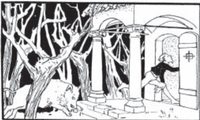
Das „Tapfere Schneiderlein“ lockt das böse Wildschwein in eine Falle.