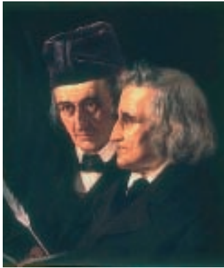
Die Brüder Jacob und Wilhelm Grimm sammelten und bearbeiteten Märchen.

In fast der Hälfte der über 200 gesammelten Märchen der Gebrüder Grimm kommen Natur, Wald, Jäger und Jagd vor. Doch sind die Jagd und ihre Akteure nur zufälliges Beiwerk oder ist der Jäger ein wichtiges Symbol des deutschen Volksmärchens? Jacob Grimm (1785 – 1863) und sein Bruder Wilhelm (1786 – 1859) entstammten einer calvinistischen Hanauer Familie mit neun Kindern. Sie studierten an der Philipps-Universität in Marburg Rechtswissenschaft und machten, mit der Literatur von Goethe und Schiller schon bestens vertraut, Bekanntschaft mit den Werken von Johann Gottfried Her-