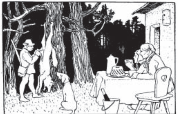
In „Rotkäppchen“ ist der Jäger der Retter vor dem bösen Wolf.

Schwarz-weiße Illustrationen: O. Ubbelohde, Brüder Grimm-Museum