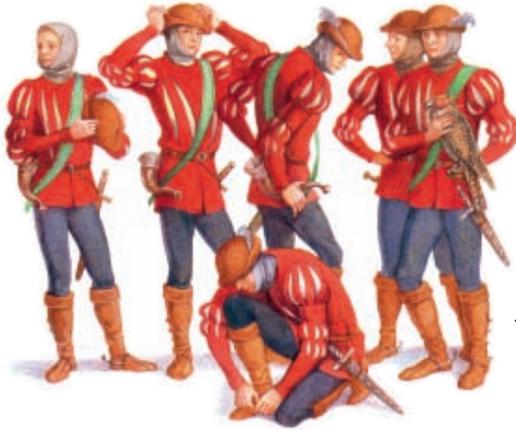
In „Die zwölf Jäger“ verkleiden sich zwölf Jungfrauen als Jäger.

Jäger eine zentrale Handlung. Ein Lächeln wird wohl jedem „jägerischen Märchenonkel“ über die Lippen huschen, wenn die Märchen in fantastischer Weise die Fähigkeiten des Jägerhelden in den Bereich des Jägerlateins